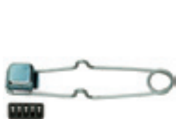
26-SL Upaljač s kremenima