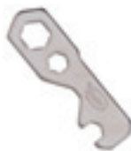
I-62-X Ključ opće namjene